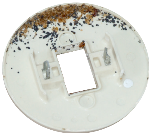
Abb. 3: Häutungshüllen und Kotpuren von Bettwanzen in einem Lichtschalter

Kotspuren in Form von schwarzen Punkten hinterlassen (siehe Abbildung 2). In den Verstecken findet man auch ihre Häutungshüllen (siehe Abbildung 3). An dem Vorhandensein von Bettwanzen, ihren Kotspuren und Häutungshüllen ist ein Befall eindeutig zu erkennen. Manchmal hinterlassen Bettwanzen nach dem Blutsaugen winzige Blutflecke auf der Kleidung oder der Bettwäsche der Betroffenen. Der Nachweis eines Bettwanzenbefalls kann sehr schwierig sein, insbesondere wenn es sich um einen leichten Befall handelt und die Verstecke der Tiere nicht gefunden werden. Sollte der Verdacht aufkommen, dass ein Bettwanzenbefall vorliegt, muss ein Schädlingsbekämpfer verständigt werden. Nur auf Basis einer eindeutigen Befallsdiagnose kann eine erfolgreiche Bekämpfung durchgeführt werden.