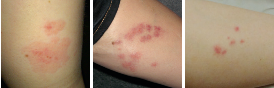
Abb. 1: Beispiele für Bettwanzenstiche

sich aber im Verlauf eines Befalls, das heißt bei wiederholter Stichbelastung, ändern kann. Häufig treten die Hautreaktionen zeitlich verzögert auf, wobei eine Verzögerung von mehr als einer Woche möglich ist. Bettwanzenstiche sind meistens gruppenweise bzw. in Reihe angeordnet, können aber auch einzeln auftreten.