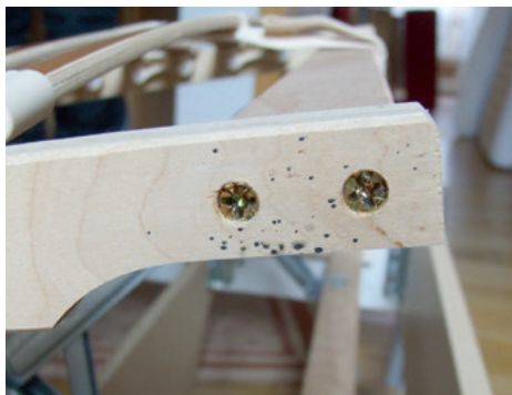
Abb. 2: Kotpuren von Bettwanzen an einem Lattenrost

Die Diagnose „Bettwanzen“ steht oft schnell im Raum, ohne dass Bettwanzen nachgewiesen werden können. Dies kann zu unüberlegten Gegenmaßnahmen führen, die bestenfalls wirkungslos sind. Häufig ist eine intensive Recherche notwendig, um der Ursache für die Stichbelästigung auf die Spur zu kommen.